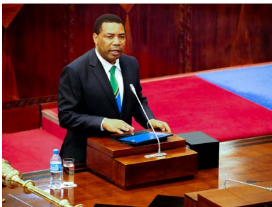
▶ Waziri wa Fedha, Mhe. Dkt. Mwigulu Lameck Nchemba (Mb), akiwasilisha bungeni muswada wa Sheria ya Ununuzi wa Umma wa mwaka 2023.

Akiwasilisha muswada huo bungeni, Waziri wa Fedha, Mhe. Dkt. Mwigulu Lameck Nchemba (Mb), alisema lengo la kutungwa kwa Sheria hiyo ni kuweka masharti bora ya usimamizi wa ununuzi wa umma, ugavi na uondoshaji wa mali kwa njia ya zabuni.