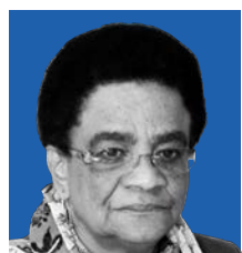
MHE. ZAKHIA H. MEGHJI 2005 - 2007